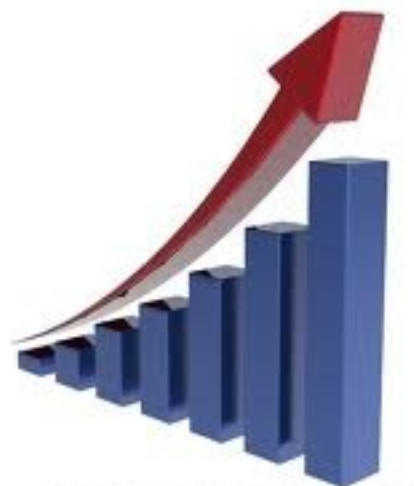
ESERCIZI DI CATEGORIA SUPERIORE