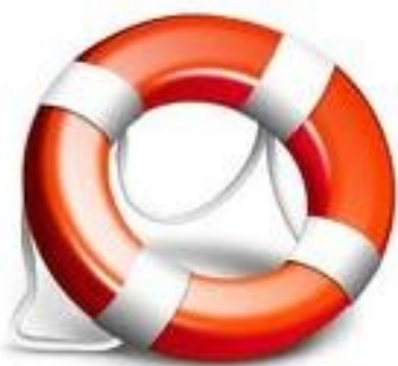
ESERCIZI DI CONFIDENZA

Una volta giunti all'ultimo livello di calibrazione di un esercizio di confidenza, potete passare ad eseguire gli esercizi di categoria superiore. È possibile, che non ci sia omogeneità nell'andamento degli esercizi ad esempio è possibile che con l'esercizio di riconoscimento del movimento delle articolazioni del braccio ( ...dimmi quale snodo muovo...), abbiate superato tutti i livelli e che l'esercizio ora avvenga in modo davvero semplice, mentre per l'esercizio del movimento delle dita ( ...dimmi quale dito muovo...) ancora il paziente-familiare faccia degli errori ed abbia ancora bisogno di continuare con tale esercizio di confidenza. In questi casi come suggerito nella sezione dedicata agli esercizi di confidenza, l'ultimo livello di calibrazione corrisponde ad un esercizio di categoria superiore. Vi troverete quindi in un momento di transizione dove raggiungerete gradualmente gli esercizi di categoria superiore, ogni volta che raggiungerete il massimo livello di calibrazione di un esercizio di confidenza, passerete al corrispondente negli esercizi di categoria superiore. Per gestire la rotazione degli esercizi ricordatevi quello che vi ho raccontato nella lezione 22 .